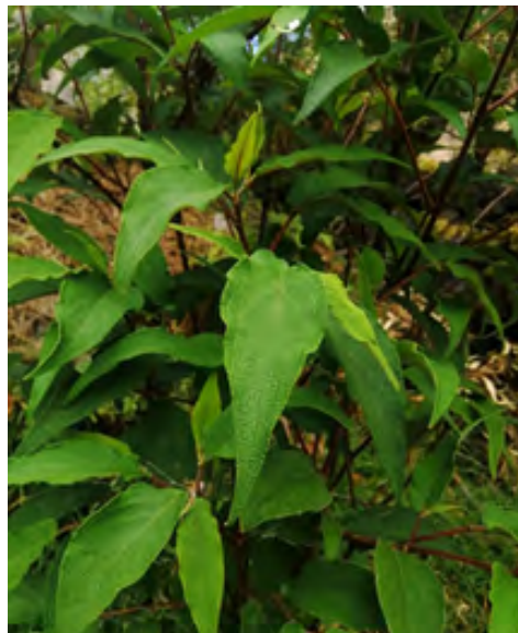
Figura 2. Piper aduncum L. (matico) en el valle del Mantaro distrito de Mariscal Cáceres, provincia y región de Huancavelica – Perú.