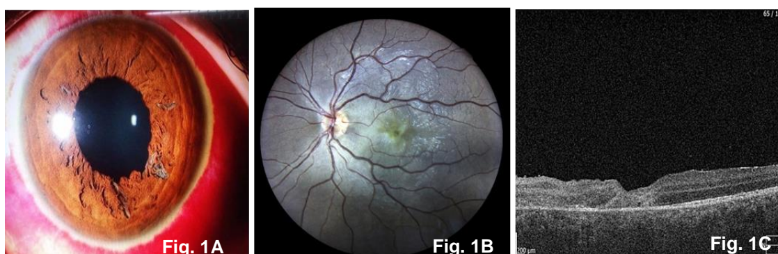
Figura 1. 1A. Retinografía del segmento anterior ocular, que describe hiposfagma 360°, córnea transparente, atrofia iridiana desde hora 2 a hora 7, con esclerosis cristaliniiana nuclear grado 1. Figura 1B. Retinografía, revela una lesión macular central de 1 disco de diámetro con fibrosis, y Figura 1C. OCT del OI en el momento de la presentación que muestra rotura de la unión de los segmentos internos y externos de los fotorreceptores con el correspondiente aumento de la reflectividad, infiltración de la pared retiniana y desprendimiento del epitelio pigmentario retiniano. El grosor de la retina fue de 276 \mu\text{m} en el sitio de la lesión.