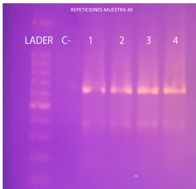
Figura 3. Electroforesis en gel de agarosa al 1,5% del RFLP con la enzima de restricción HhaI.

positiva para el análisis de restricción, observándose los diferentes tamaños generados debido a los cortes que genera la enzima HhaI. De las 45 muestras analizadas solamente una es resistente a la Claritromicina, presentando la mutación T2717C.