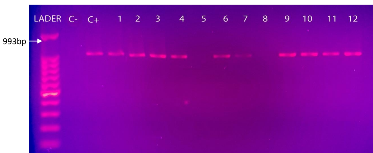
Figura 1. Electroforesis en gel de agarosa al 1,5% de la amplificación por PCR del gen 23S ARNr.

La segunda reacción de PCR (seminested) se llevó a cabo a partir del producto de la primera reacción, se utilizó los primers HP4 y HP2 para la amplificación del gen 23S ARNr. En la Figura 2, se utilizó el mismo ladder o marcador de peso molecular en la escala de 1000bp; y, se obtuvo un segundo