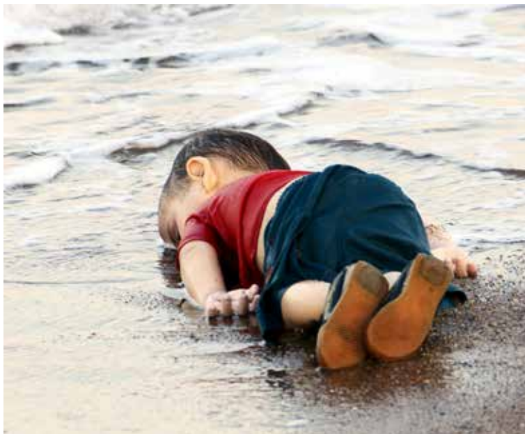
Imagen 1: Aylan Kurdi, ahogado en las playas de Turquía