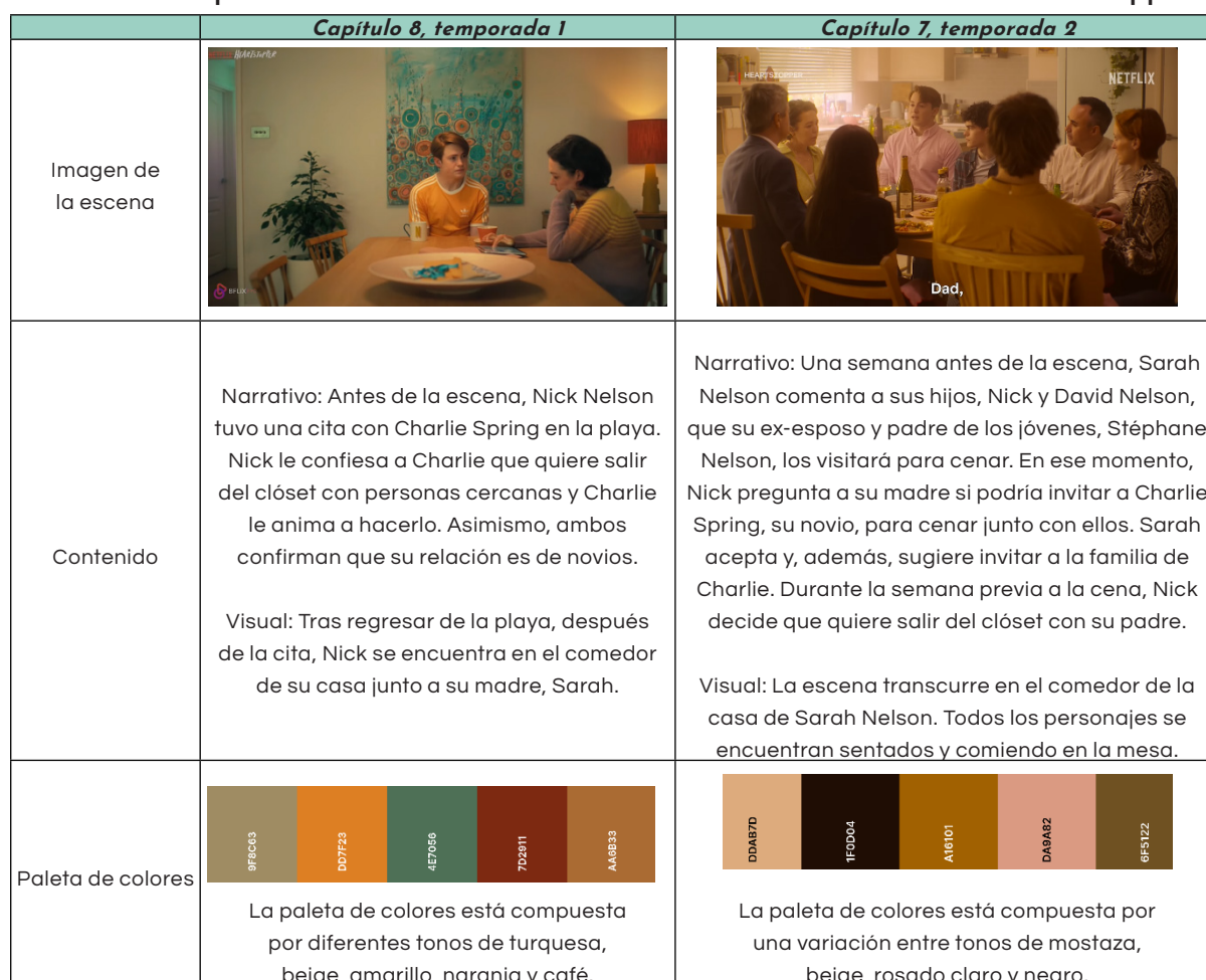
Tabla 2. Comparación entre las escenas referentes a “salir del clóset” en Heartstopper

Para comenzar, es necesario comprender los sucesos que se desarrollan en las dos escenas seleccionadas con la temática de “salir del clóset”. Para ello, se presenta una tabla comparativa de las escenas correspondientes a cada temporada, destacando los personajes presentes, el escenario donde se desarrollan los sucesos, paleta de colores, los diálogos, entre otros.