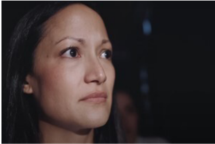
Figura 5. Ingreso a la sala.