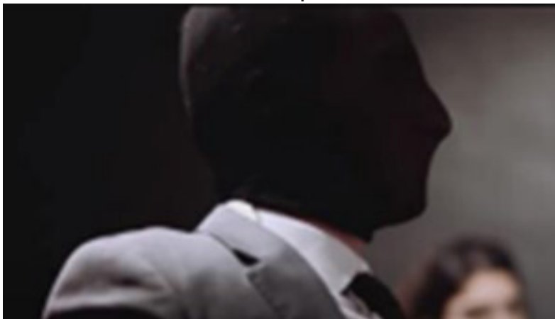
Figura 6. Rostros tapados.

Recuperado de "La cumbia feminazi - Renee Goust" YouTube: https://www.youtube.com/watch?v=TuT3bYuio64