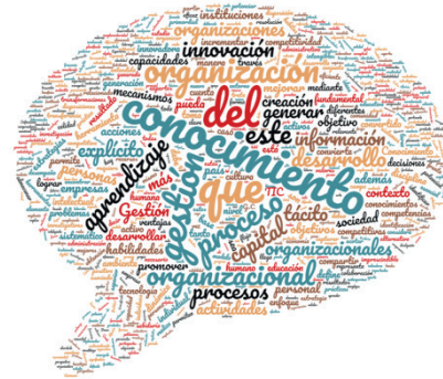
Figura 3 Nube de palabras que identifica gestión del conocimiento en américa latina