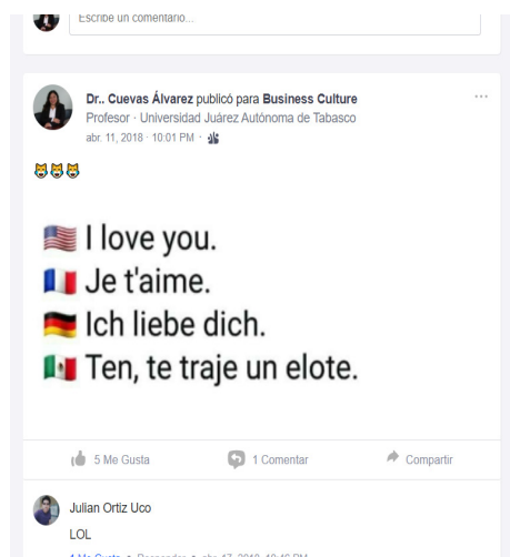
Figura 2. Interacción visual de participantes. Foro del grupo.

A partir de las actividades realizadas y posterior a las imágenes, los videos y comentarios de parte de los participantes, se realizó el análisis de la interacción virtual de los mismos en el grupo de la plataforma Edmodo . Dentro de ese material provisto, también se procuró incluir aspectos lúdicos y educativos que permiten entender la idiosincrasia de cada una de las culturas presentadas.