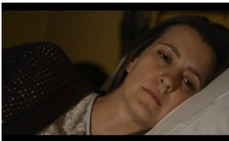
Figura 9 - Madre en Amarillo .