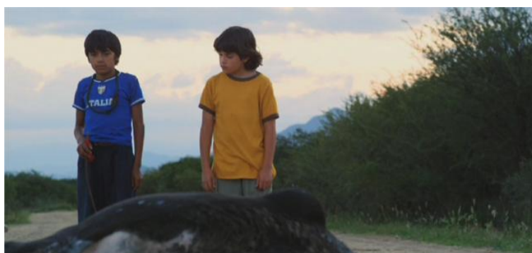
Figura 6 - Posición según un grado mayor de empatía.