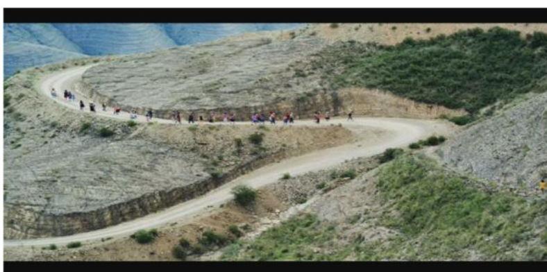
Figura 3 - Campesinos dirigiéndose a la ciudad.

Por otro lado, la escena en la que el grupo de campesinos marchan, como una masa humana hacia la ciudad, a través del uso de panorámicas extendidas, vincula una vez más a la masa de gente como parte del paisaje nacional. Sin embargo, en RAV , la masa de gente aparece en la escena como una fila de hormigas, recorriendo una superficie para finalmente infestar un lugar. Aquí existe un paralelismo con la escena de hormigas que estaban siendo exterminadas en la casa del niño del ESTE / BLANCO sugiriendo no la unión de Bolivia sino todo lo contrario. (fig. 3-4).