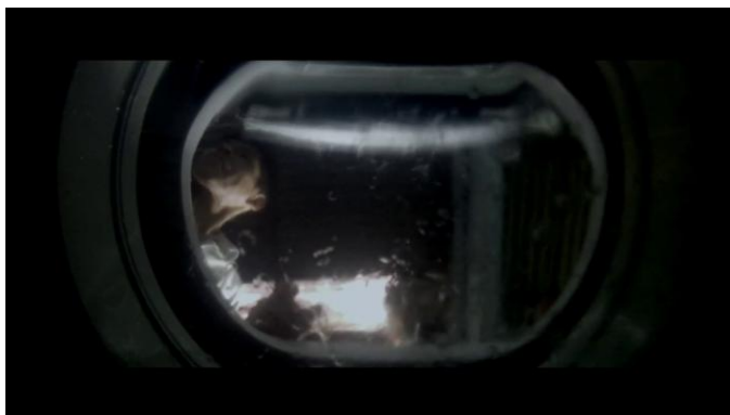
Figura 13 - Las lavadoras como metáfora de la identidad en la posmodernidad líquida.