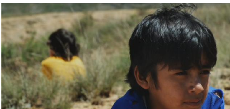
Figura 5 - Posición según el grado de poca empatía.

Por último, como sexto factor, RAV parece sugerir cómo sólo a través del afecto y la empatía podemos reducir la brecha que separa al ESTE / BLANCO del OESTE / INDÍGENA de Bolivia y conectarnos con “el otro” distinto de nosotros. La única vez que la barrera parece quebrantarse es cuando los dos niños se interesan por los problemas del otro. Al comienzo del film, un plano medio encuadra al niño indígena buscando a su vaca con el niño blanco de espaldas mostrando desinterés. Cerca del final de Amarillo tenemos un plano medio similar cuando los dos niños contemplan la vaca muerta del niño indígena, pero esta vez el niño del ESTE se encuentra físicamente parado al lado del niño indígena, conmovido por su drama. En otra secuencia, se resalta la compasión que crece en el niño indígena por la frustración del niño chapaco al no poder encontrar la manera de regresar a su casa. A través de estas tomas, el filme sugiere cómo las posiciones de los niños cambian de acuerdo a su mayor o menor empatía (Fig. 5-7).