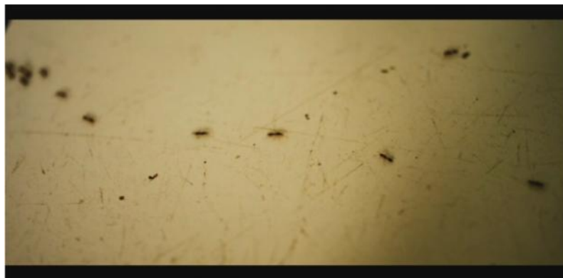
Figura 4 - Hormigas infestando la casa del niño del ESTE.

Por último, como sexto factor, RAV parece sugerir cómo sólo a través del afecto y la empatía podemos reducir la brecha que separa al ESTE / BLANCO del OESTE / INDÍGENA de Bolivia y conectarnos con “el otro” distinto de nosotros. La única vez que la barrera parece quebrantarse es cuando los dos niños se interesan por los problemas del otro. Al comienzo del film, un plano medio encuadra al niño indígena buscando a su vaca con el niño blanco de espaldas mostrando desinterés. Cerca del final de Amarillo tenemos un plano medio similar cuando los dos niños contemplan la vaca muerta del niño indígena, pero esta vez el niño del ESTE se encuentra físicamente parado al lado del niño indígena, conmovido por su drama. En otra secuencia, se resalta la compasión que crece en el niño indígena por la frustración del niño chapaco al no poder encontrar la manera de regresar a su casa. A través de estas tomas, el filme sugiere cómo las posiciones de los niños cambian de acuerdo a su mayor o menor empatía (Fig. 5-7).