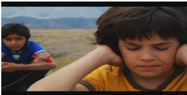
Figura 7 - Posición según un grado de empatía.

RAV finalmente cierra con primeros planos de las tres madres tristes con la mirada perdida, unificando de esta manera las tres historias y a las tres regiones, no bajo el símbolo de unión que representa la bandera boliviana, sino bajo la imagen pesimista de una madre en lágrimas. La madre queda como el lugar simbólico del desencuentro, dejando en claro que, por ahora, los bolivianos, estamos huérfanos (Fig. 8 - 10).