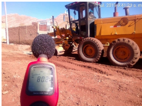
a) Monitoreo de motoniveladora

Se ha considerado las etapas principales para la conformación de la estructura de un pavimento rígido que requiere el uso de maquinaria. El monitoreo al Nivel de Presión Sonora se realizó a un radio promedio de 5 m de la fuente de ruido dentro de la cual un trabajador realiza sus labores. En la Figura 2 se observa el monitoreo realizado al equipo mecánico pesado y liviano, además en la parte inferior de la misma se muestra los niveles de presión sonora alcanzados por toda la maquinaria estudiada, los mismos superan los 60 dBA para zona residencial y algunos los 85 dBA para el caso del análisis del tiempo de exposición del trabajador en una jornada laboral.