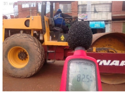
e) Monitoreo del rodillo vibratorio