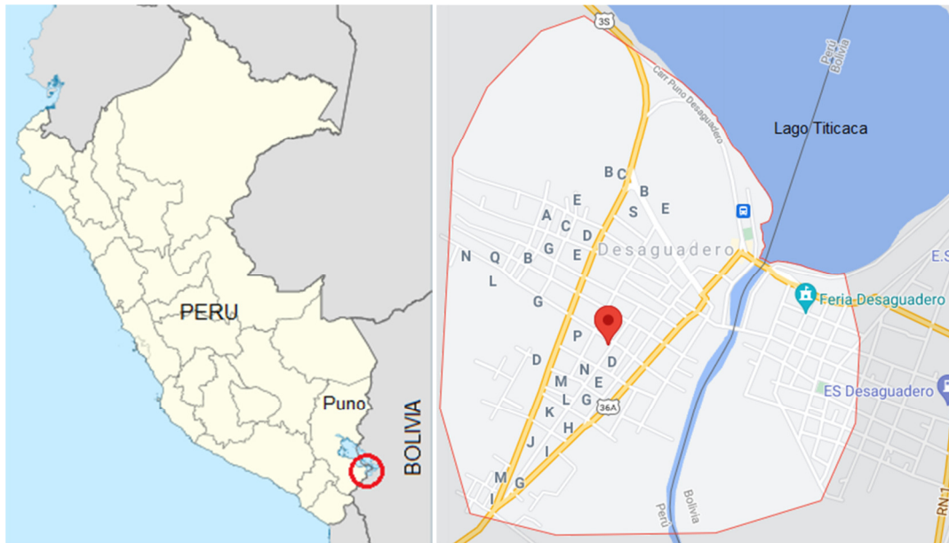
Figura 1: Zona de estudio, 2019. Vista de detalle extraída de Google Maps.

En la medición del nivel de presión sonora se utilizó un Sonómetro clase 2 PRASEK PREMIUN modelo PR-352 con protector anti viento en el micrófono en dirección a la fuente sonora. Se registraron mediciones a intervalos de 5 minutos en el tiempo de funcionamiento de la maquinaria en operación. Se ha controlado las interferencias y las barreras que pudieran existir, suspendiéndose la medición del ruido cuando se presentó este tipo de interferencias. Los equipos monitoreados son los indicados en las Tabla 4 y 5, y las etapas para la construcción del pavimento rígido se muestran en la Tabla 6.