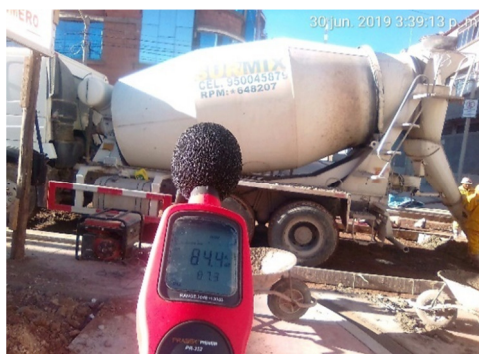
c) Monitoreo de camión mixer