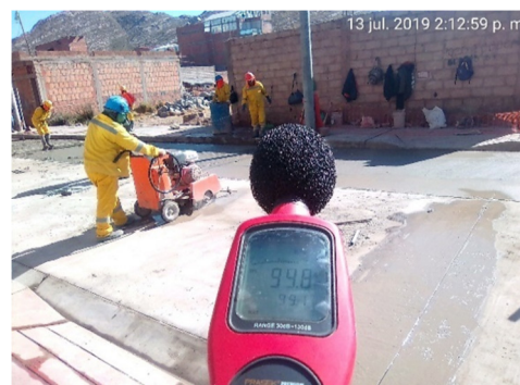
d) Monitoreo de cortadora de concreto