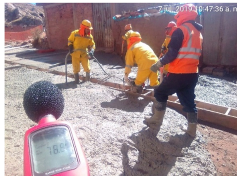
b) Monitoreo del vibrador de concreto