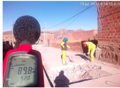
f) Monitoreo del rotomartillo