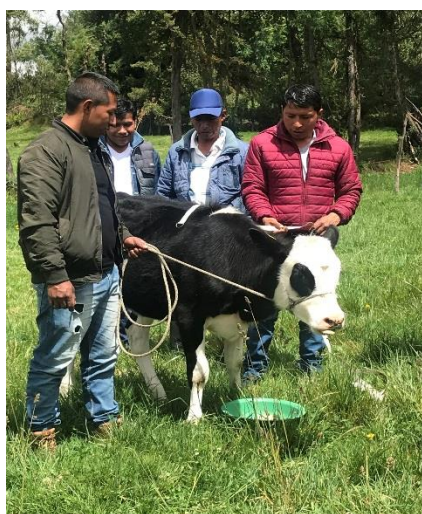
Figura 3. Grupo de discusión organización de productores departamento de Nariño- proyecto CDVL.

Los productores encuestados de los dos departamentos han participado en mayor medida en metodologías como los días de campo, grupos de discusión (Figura 3) y talleres. Se encuentra una diferencia en la participación en cursos, demostraciones de método y los denominados “otros” por parte de los productores de Nariño en comparación con los productores de Boyacá. Las metodologías en donde consideran han adquirido mayor aprendizaje son días de campo, grupos de discusión y talleres. Teniendo en cuenta que estas metodologías fueron trabajadas por el proyecto puede explicar los resultados. Sin embargo, el departamento de Boyacá reconoce a las escuelas de campo como una metodología de aprendizaje por encima de los días de campo y talleres.