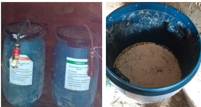
Figura 1. Biofermentador para producción de EM.

mescló con 10 kg de estiércol fresco de vacuno, 5 kg de melaza de caña disuelta, 5 litros de leche fresca, 20 litros de mucilago de cacao, 0.5 kg de levadura de pan y 1 kg de polvillo de arroz, toda esta mezcla se preparó en un cilindro de 80 L, acondicionado con un respirómetro a base de manguera y 1 botella de plástico de 500 ml (Figura 1).