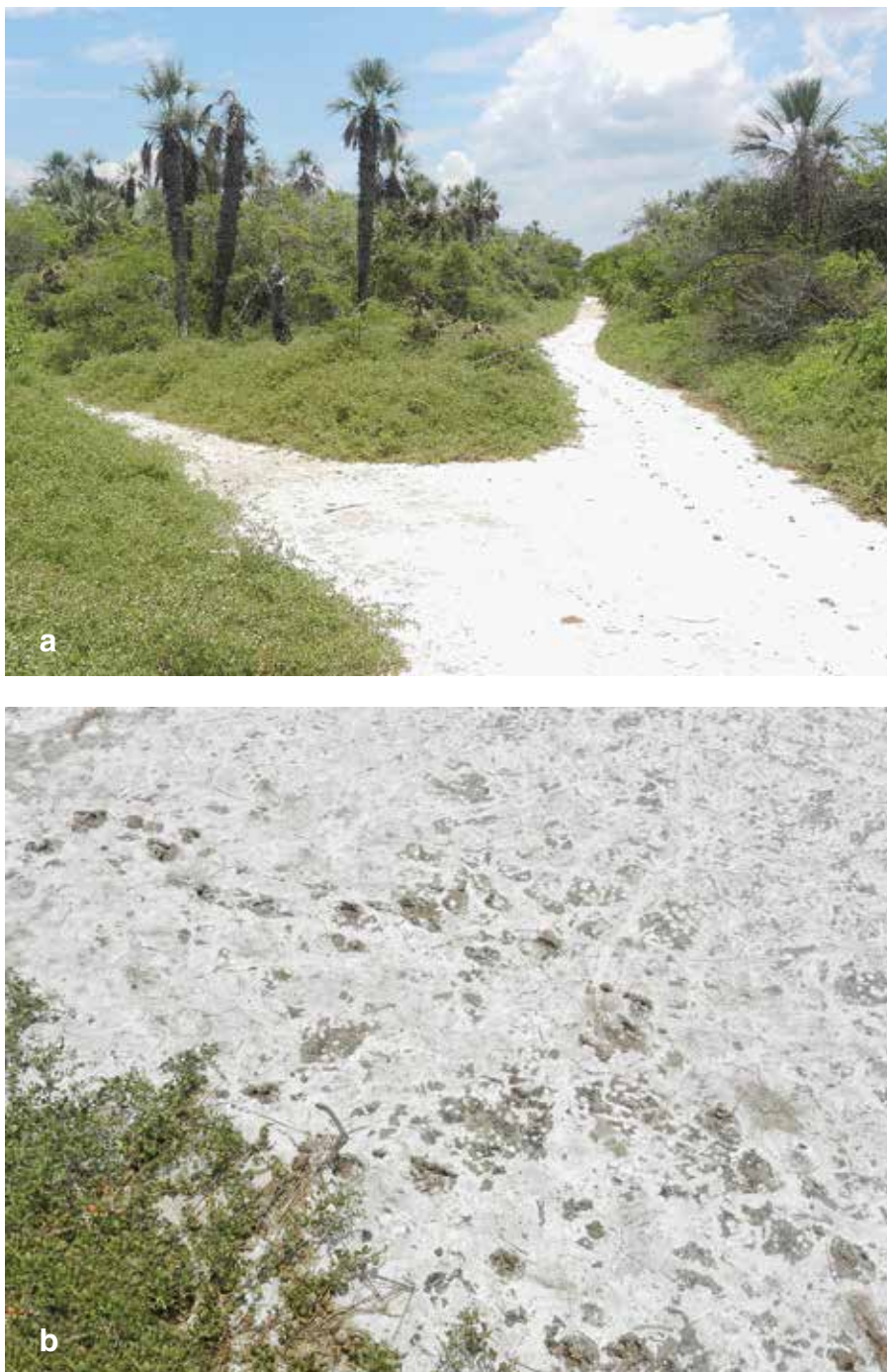
Figura 2. Formaciones de Trithrinax schizophylla en el Área Protegida Palmera de Saó (APPS). a. Palmares de saó y b. asociación con suelos salinos.