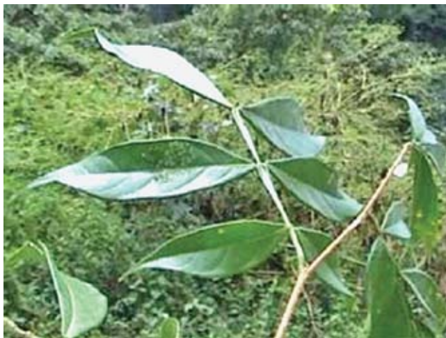
Fig. 5: Planta hospedera Inga cf. semialata .