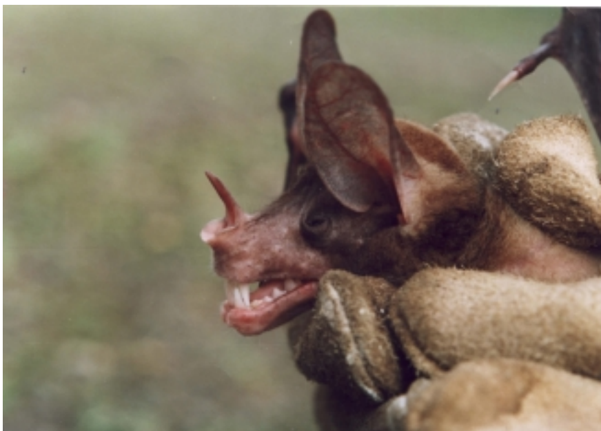
Fig. 1: Individuo de Vampyrum spectrum capturado en la localidad de Arepucho, Parque Nacional Carrasco.

El individuo del Parque Nacional Carrasco fue capturado en una red de neblina, en el sotobosque de un bosque alto ribereño montano con abundantes árboles de Ficus maxima cubiertos de musgos y epífitas. A su vez, los dos ejemplares del Parque Nacional Noel Kempff Mercado fueron capturados entre 50 y 60 m de la línea de bosque. En cuanto a horarios de actividad, el individuo registrado en Madidi