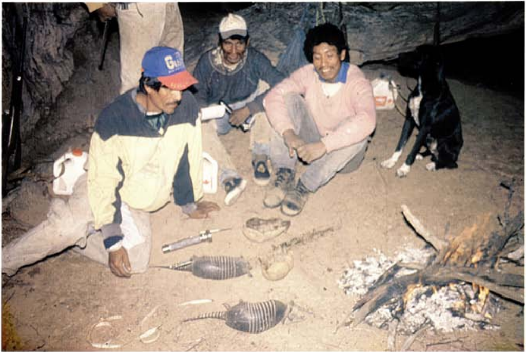
Foto 9: Cazadores izoceños tomando datos de Dasybus novemcinctus y Tolypeutes matacus