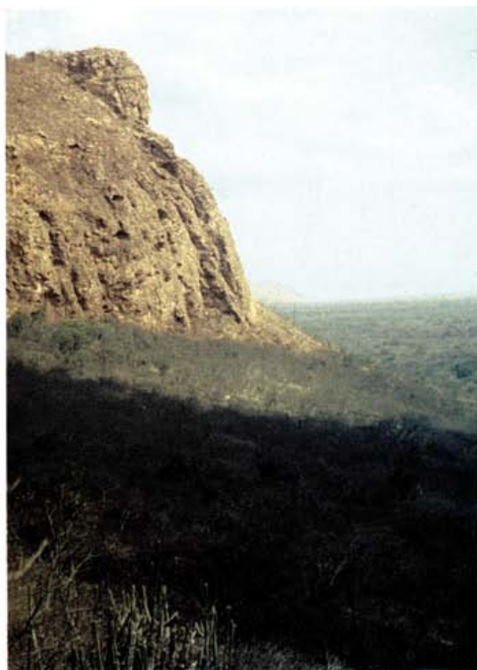
Foto 2: Monte bajo en las zonas secas del Izozog. Cerro Colorado