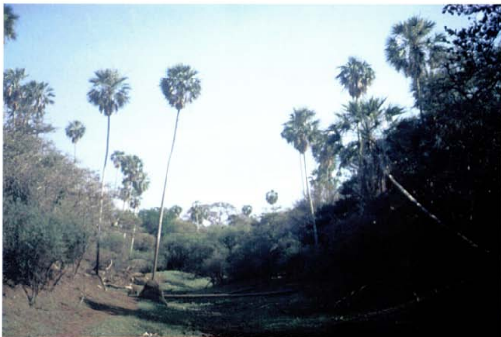
Foto 3: Monte alto en la zona de Bañados del Izozog, La Madre