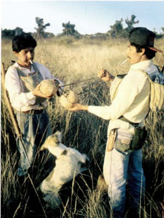
Foto 10: Cazadores izoceños con Tolypeutes matacus