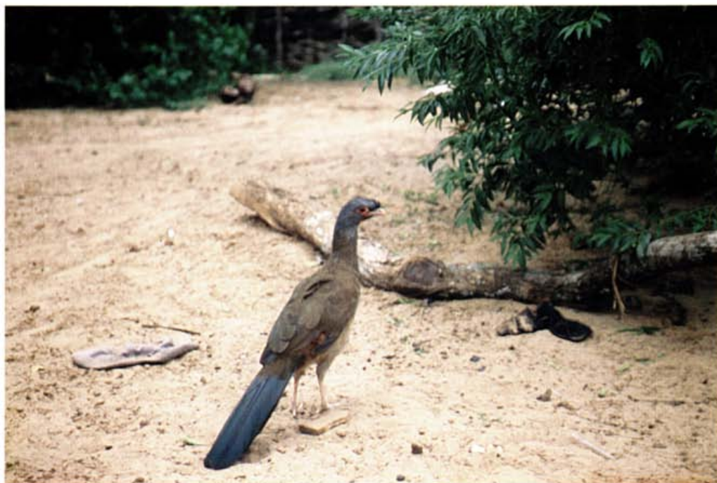
Foto 5: Charata Ārāküü- Ortalis canicollis , especie endémica al Gran Chaco