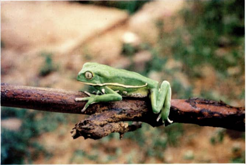
Foto 7: Phyllomedusa sauvagii , especie típica del Chaco