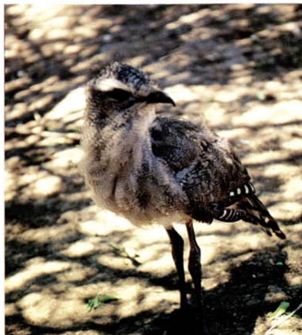
Foto 6: Socori patas negras-Guokoko- Chunga burmeisteri , especie endémica al Gran Chaco