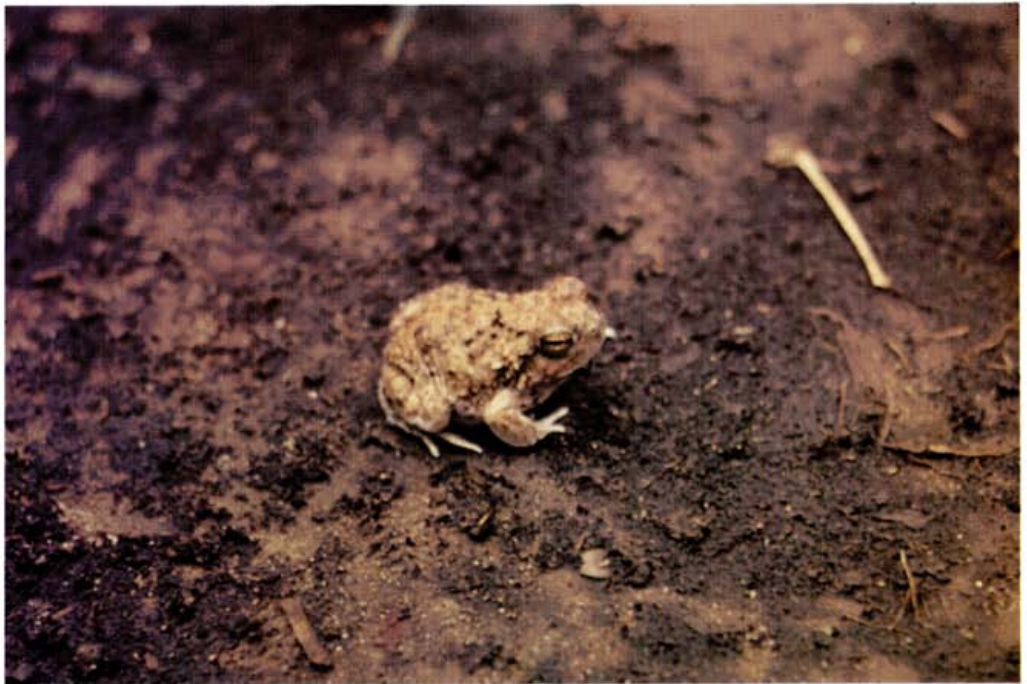
Foto 8: Pleurodema guayape , nueva especie para Bolivia