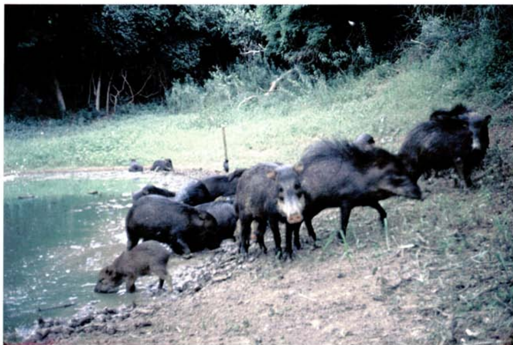
Foto 4: Trampas cámara, tropero-Tayaju- Tayassu pecari , Cupesí