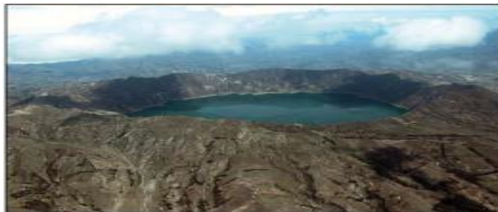
Figura 2. Vista aérea de la laguna craterica volcánica. Quilotoa. Cotopaxi. Ecuador.

El paisaje y los rasgos que se observan actualmente en el volcán son la consecuencia de una serie compleja de sucesivos eventos geológicos, volcánicos y eruptivos. El volcán Quilotoa comprende una caldera sub-circular con una laguna de 3,6 Km 2 (ver figura 2), que tiene una profundidad de 256 m aproximadamente y un volumen de agua estimado de 0,35 Km 3 . La caldera se encuentra asentada sobre un viejo edificio volcánico basal de 6 Km de diámetro. Emisiones de CO 2 , sobre la superficie del agua, se pueden observar en diferentes zonas lago. (Orellana, 2009). Este lago ha sido objeto de estudios en diferentes campos del conocimiento, entre ellos el químico, pero no se han desarrollado estudios microbiológicos (Aguilera et al., 2000; Cerón, 2002; Gunkel et al., 2007; Gunkel et al., 2008; Hall & Mothes, 2008; Orellana, 2009; Bustos & Serrano, 2014; González et al., 2020).