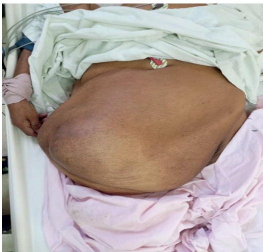
Figura 1. Hernia incisional gigante en paciente con antecedente de obesidad mórbida