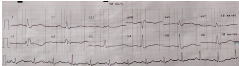
Figura 2: Electrocardiograma donde se evidencia aplanamiento del segmento ST en cara inferior con inversión de onda T en cara antero-septal