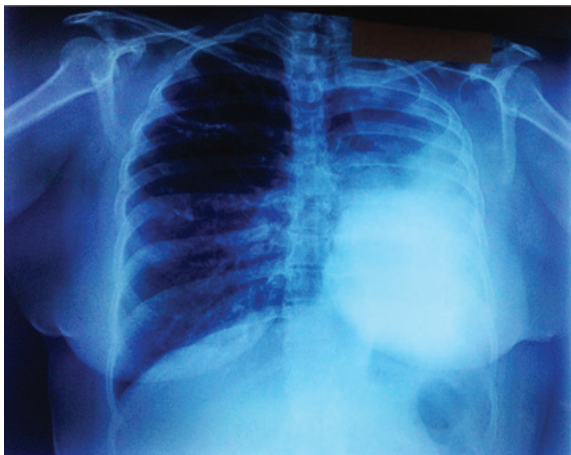
Figura 1: Radiografía PA de tórax: opacidad homogénea en campo pulmonar medio e inferior izquierdo con borramiento del surco costofrénico asociado a desplazamiento de las estructuras del mediastino a la izquierda y signos de hiperinsuflación del pulmón derecho.

evidencian hallazgos de taquicardia sinusal, desviación a la derecha, Infarto antiguo en miocardio lateral alto, motivo por el cual se solicitó el ecocardiograma para descartar otras malformaciones congénitas o enfermedades adquiridas y se mostró miocardiopatía dilatada con disfunción sistólica grado III e hipertensión pulmonar secundaria. La prueba de función pulmonar muestra un patrón obstructivo con ligera reversibilidad con broncodilatadores.