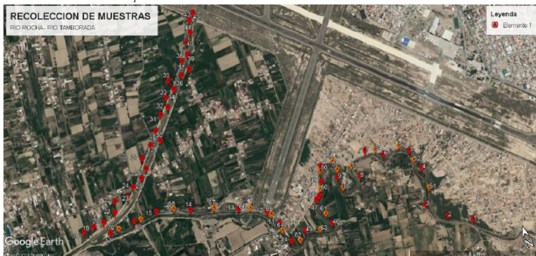
Figura 1. Mapas de la recolección de muestras en los ríos Rocha (vertical) y río Tamborada (horizontal) a lo largo de 2,5 km en el río Rocha y 3,5 km en el río Tamborada. El aeropuerto se muestra al norte, los cultivos más concentrados al oeste y sur en la periferia del río. En ROJO las muestras procesadas por centrifugación. En NARANJA las muestras procesadas con caldo BHI.

(McFarland de 0,5), y sembradas en Agar Mueller Hinton. Para determinar la producción de BLEE se siguió el método de Jarlier 13,14 , con discos Cefotaxima y Ceftazidima (30 µg) ubicados a ambos lados (25 mm) del disco de Amoxicilina y ácido clavulánico (20/10 µg), la formación de halos de inhibición con agrandamiento en la interface entre la cefalosporina y el inhibidor de beta-lactamasas (efecto huevo) indicaba la producción de BLEE. Para la determinación de Enterobacterias productoras de beta-lactamasas AmpC codificadas por un plásmido (pAmpC), se empleó el disco de Cefoxitin, en cepas que dan un halo a \leq 14 mm (resistencia) se tiene la sospecha de AmpC codificada por un plásmido (si la cepa identificada es Escherichia coli ). La identificación de las enterobacterias se realizó con baterías bioquímicas y siembra en agar cromogénico.