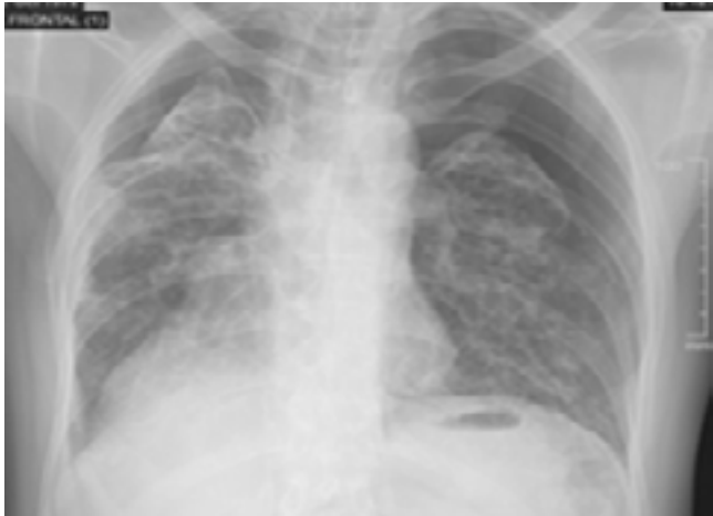
Figura 1. Radiografía de tórax frontal: Neumotórax bilateral a predominio izquierdo (30%) asociado a signos de fibrosis pulmonar