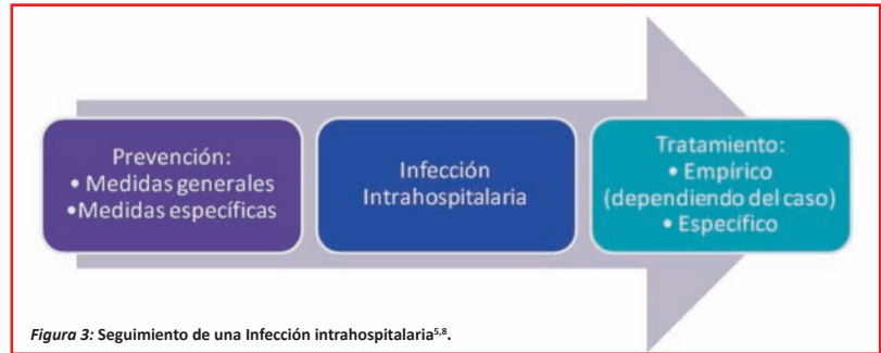
Figura 3: Seguimiento de una Infección intrahospitalaria 5,6 .