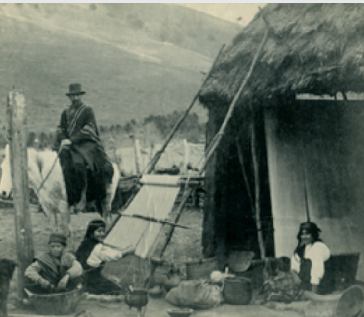
Arriba: Cercanías de la ciudad de Temuco. Región de La Araucanía, Chile. Fotografía de autor desconocido, cerca de 1900. Fuente: Mapuche. Fotografías siglo XIX y XX. Construcción y montaje de un imaginario . Margarita Alvarado, Pedro Mege y Christina Báez. Pehuén Editores, Santiago, 2001, pp. 222.