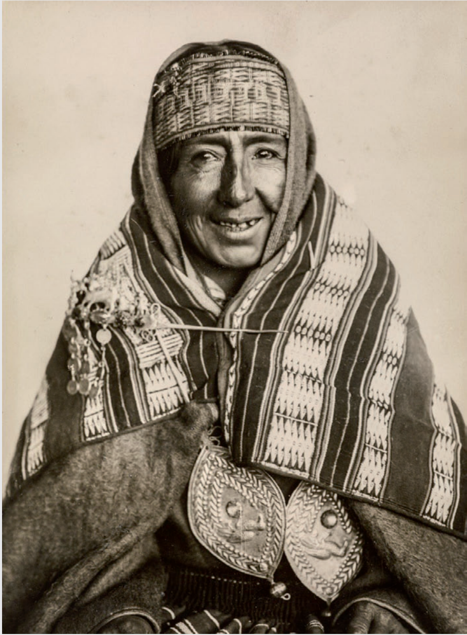
Arriba: Retrato de mujer de la provincia Muñecas. Lugar de registro: Provincia Muñecas. Fecha estimada de registro: abril de 1927-marzo de 1929.