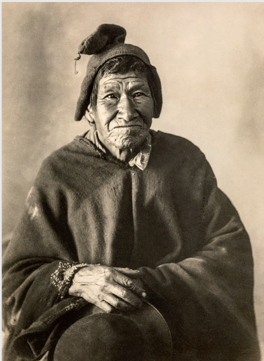
Arriba: Hombre con tocado. Fecha estimada de registro: abril de 1927-marzo de 1929.