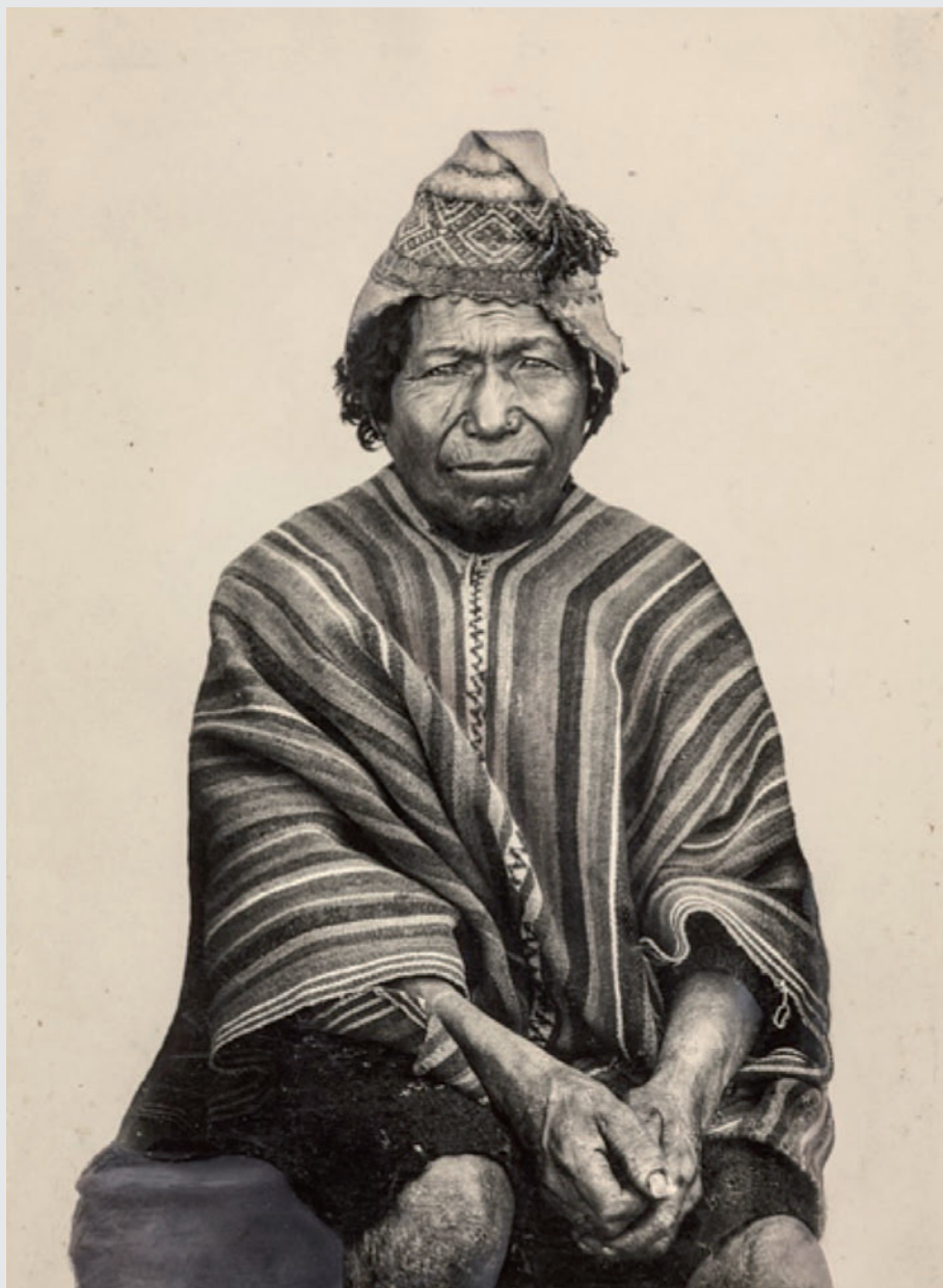
Arriba: Hombre quechua. Lugar de registro: posiblemente Bolivia, sin especificar. Fecha estimada de registro: abril de 1927-marzo de 1929.