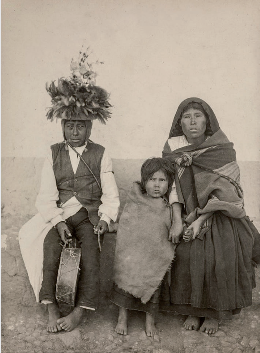
Arriba: Familia aymara. Fecha estimada de registro: abril de 1927-marzo de 1929.