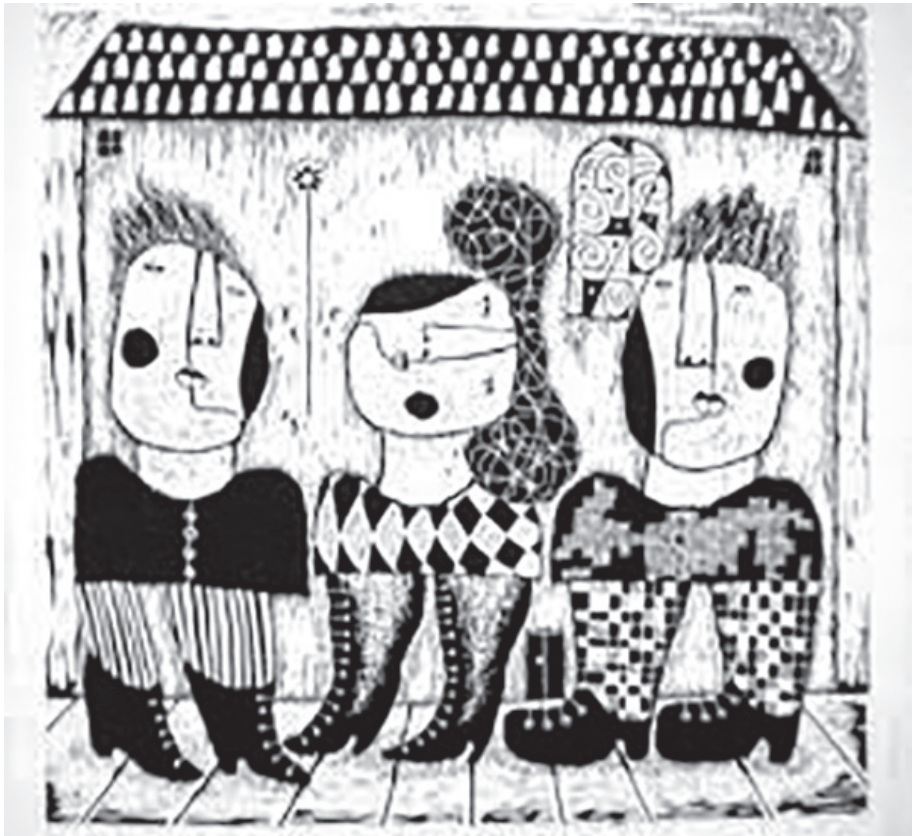
Autor: Juan José Serrano.