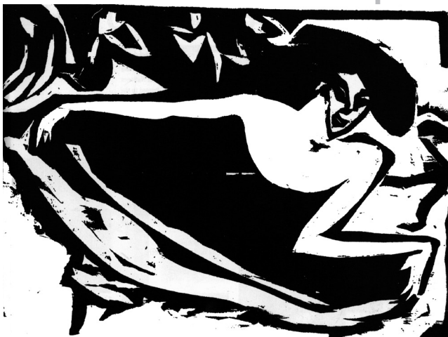
Ludwig Kirchner, "Bailadora"