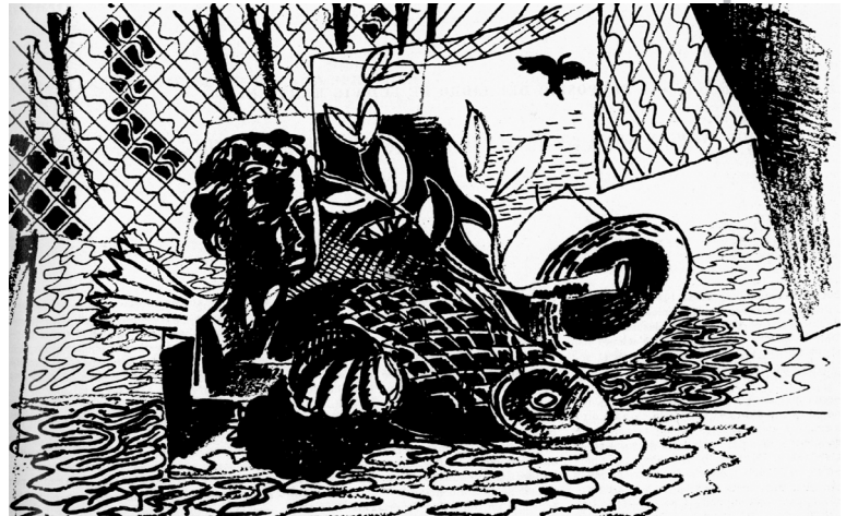
Pedro Pruna, “Naturaleza muerta”