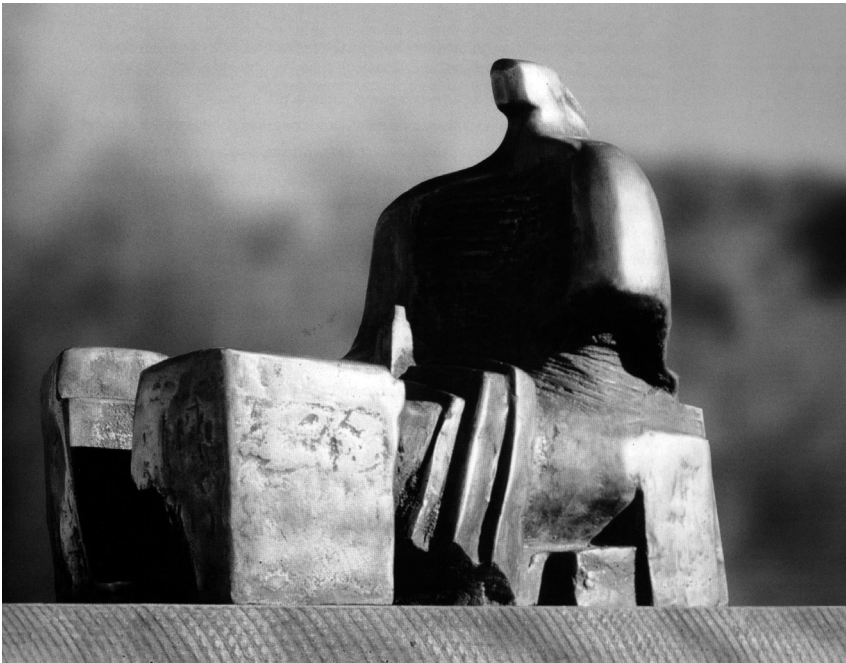
Ted Carrasco: Sin título