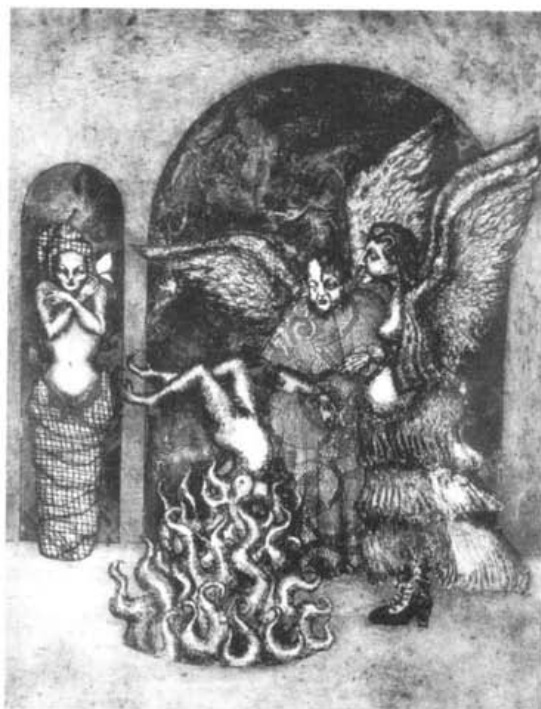
"Mariposas de fuego" Grabado sobre cobre

Yo aliento la certeza, compatriotas, amigos y colegas de que la comunidad de comunicadores profesionales aquí también representada ha de empeñarse a fondo para hacer posible la realización de este ideal de redención de nuestra amada patria.