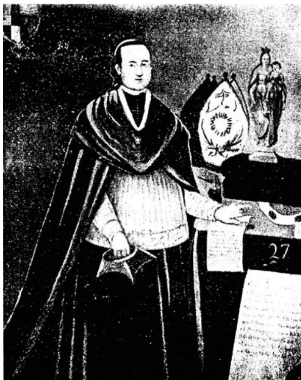
RETRATO DEL ARZOBISPO MOXÓ En la Sala Capitular Metropolitana

Retrato del Arzobispo Moxó (Primera edición de Últimos días coloniales en el Alto Perú , de Gabriel René-Moreno, 1896)