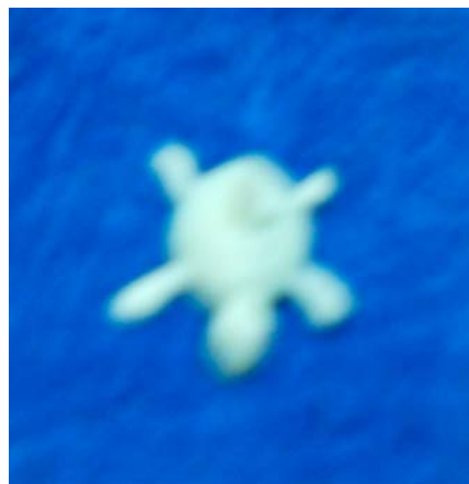
Figura # 2. Cuerpo extraño encontrado en la vía aérea.