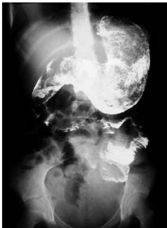
Figura # 2. Radiografía de abdomen contrastada sugerente de tricobezoar.