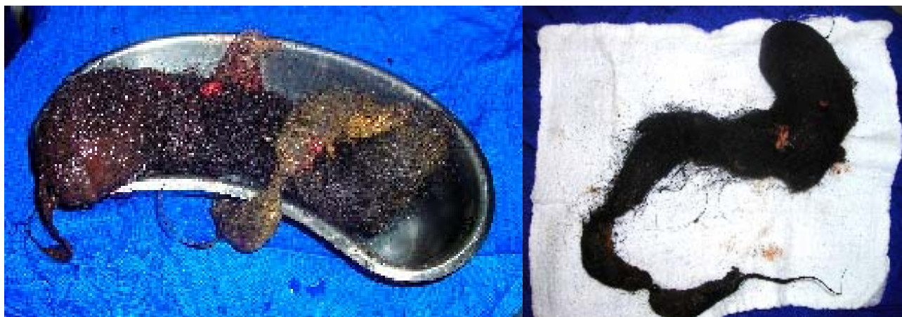
Figura # 1. Imágenes del tricobezoar en el postoperatorio inmediato.

y la tomografía axial computarizada (TAC) de abdomen fue compatible con bezoar y neumatosis gastroduodenal. Se realizó tratamiento multidisciplinario: transfusión de hemoderivados, manejo nutricional, suplemento con hierro, resolución quirúrgica del tricobezoar, apoyo psicológico y terapia psiquiátrica. Cabe hacer notar que tanto la familia como la paciente, negaron tricotilomanía y la misma que fue aceptada únicamente luego de haber visto el tumor extraído; indicando que la tricofagia tenía varios años de evolución produciendo el deterioro progresivo del estado general. Ver figuras # 1, 2 y 3.