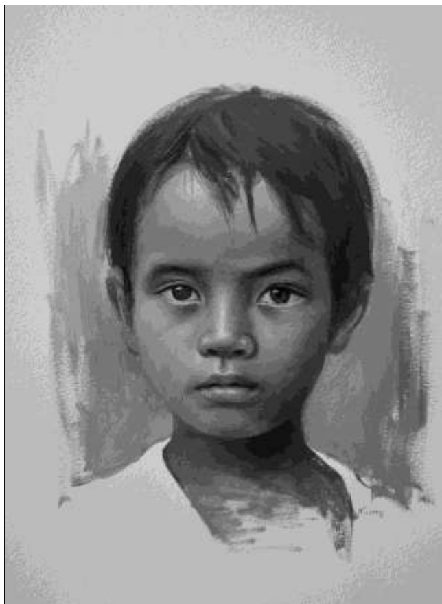
Rosmery Mamani Ventura. Niño estudio . Óleo / papel, 30 x 40 cm.

El segundo período (1870-1899) se inicia con diferentes cambios institucionales que eliminaron las barreras legales que frenaron previamente las exportaciones de plata. Esta liberalización, el descenso en los precios internacionales del transporte marítimo y la introducción del primer ferrocarril (1888) introdujeron a Bolivia de lleno a lo que se conoce como Primera Globalización, período en el cual los intercambios comerciales se incrementaron exponencialmente y se tendió a consolidar un mercado mundial de bienes 13 . Esta reinserción en la economía mundial se caracterizó inicialmente por un crecimiento tal de las exportaciones de plata que los récords coloniales pudieron ser finalmente superados. Sin embargo, los vínculos con la economía mundial determinaron también que la caída de los precios internacionales de la plata hacia 1893 se tradujesen en una fuerte crisis en las exportaciones de plata y, dado el carácter mono-exportador del país, del sector exportador en su conjunto.