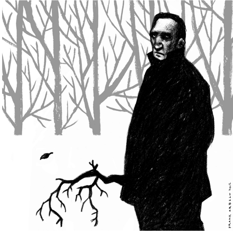
Frank Arbelo. Las hojas muertas del otoño . Grafito y color digital, 2012.