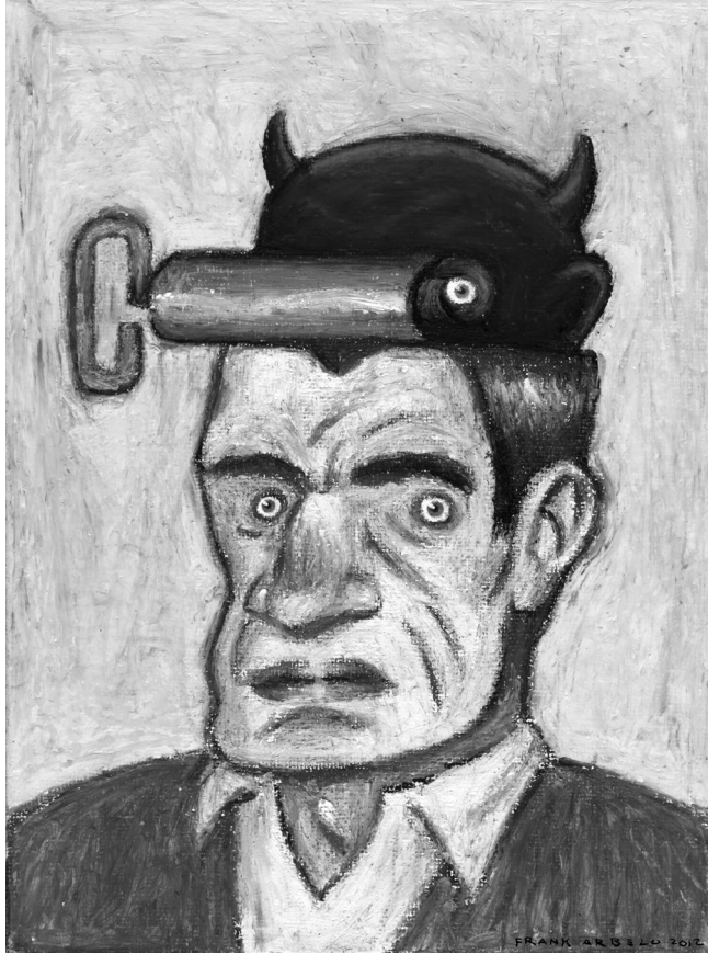
Frank Arbelo. Fausto . Pastel graso, 2012.