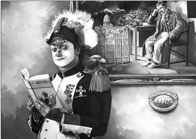
Mario Conde Cruz. Sin titulo . Acuarela, 2009.