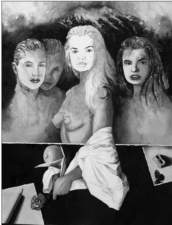
Mario Conde Cruz. De arrugados recuerdos . Acuarela, 2003.