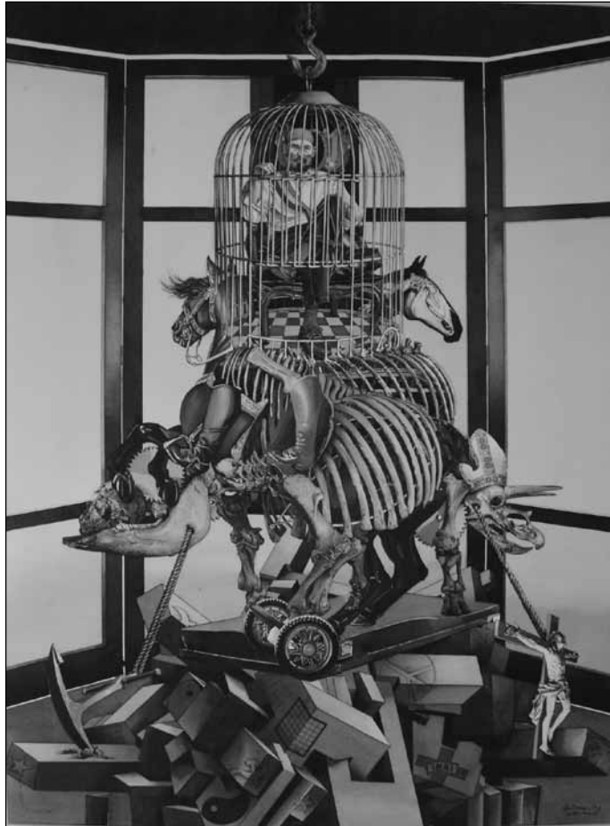
Mario Conde Cruz. Sin título . Acuarela, 2007.