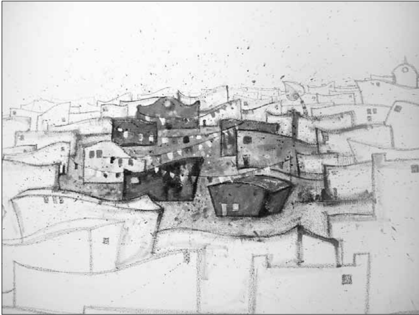
Romanet Zárate. El carnaval . Obra efímera, acrílico sobre madera. 2008