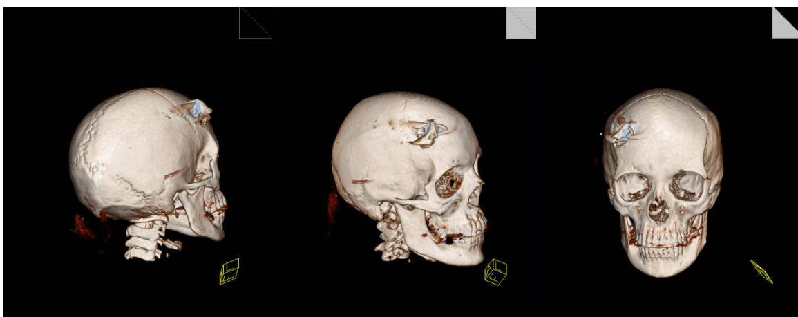
Fuente: Tomografía Axial Computarizada realizada en la unidad hospitalaria receptora del paciente.