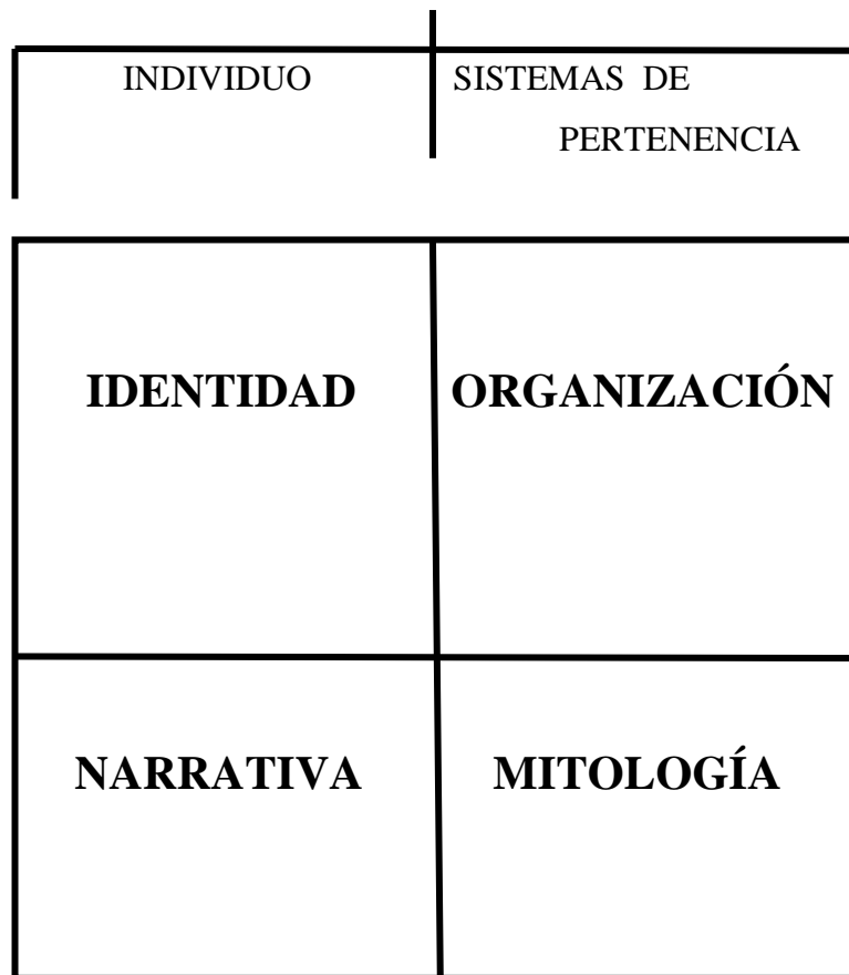
Figura 2. Narrativa

Entendemos por narrativa la atribución de significado a la experiencia relacional, algo que el ser humano hace ininterrumpidamente a lo largo de su existencia en un proceso de complejidad progresiva, desde la vida intrauterina hasta bien avanzada la edad adulta. La narrativa es también el magma constitutivo de la personalidad.