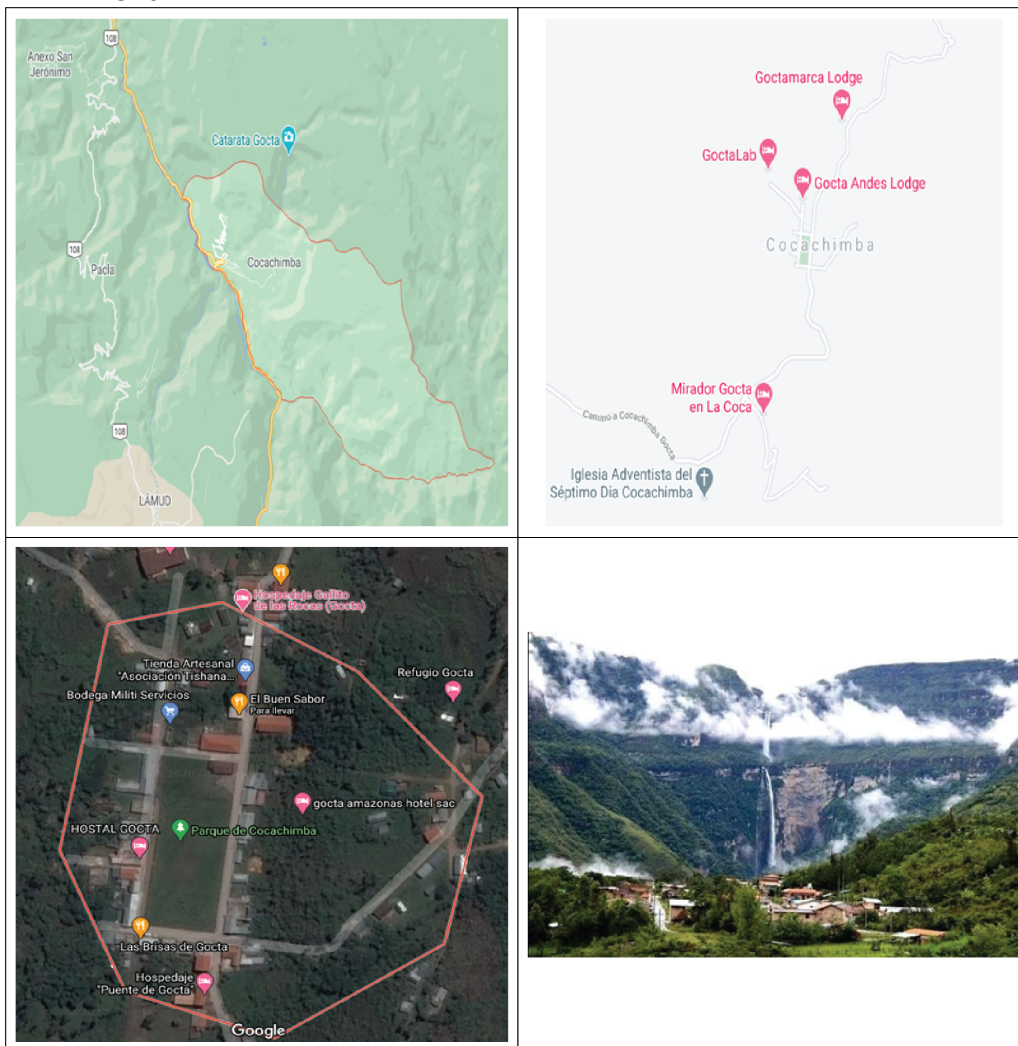
Figura 1. Ubicación Geográfica del Anexo de Cocachimba

La catarata de Gocta es un lugar con gran magnetismo debido a la mística que evidencia, y el esplendor natural que despliega por medio de las 110 especies de aves y mamíferos que aborda dentro de sus límites; donde para poder disfrutar de ello, se debe realizar una caminata por los bosques, partiendo del pueblo de Cochachimba o desde el pueblo de San Pablo, pues son las localidades más próximas, siendo un total de cinco horas de trayecto, incluyendo ida y vuelta. En tanto, para ir desde Cocachimba a Gocta (segunda caída) se tiene que realizar otro trayecto con una duración de 2 h 30 min aproximadamente (a pie o cabalgando) teniendo una distancia de seis kilómetros (Perú Travel , 2020).