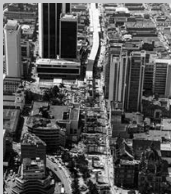
Foto 9. Se observa la intervención sobre Bolívar para la construcción del viaducto. A la derecha está el espacio para la Plazuela de las Esculturas Fernando Botero. [aprox. 1990-1995]