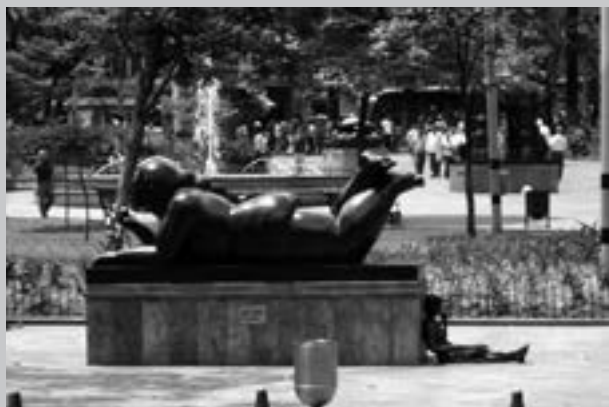
Foto 5. Indigente descansa apoyada en una escultura.