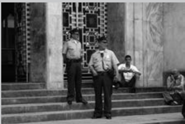
Foto 3. Ingreso al Museo de Antioquia.