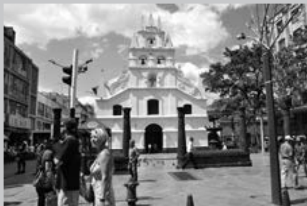
Foto 6. Iglesia de La Veracruz.