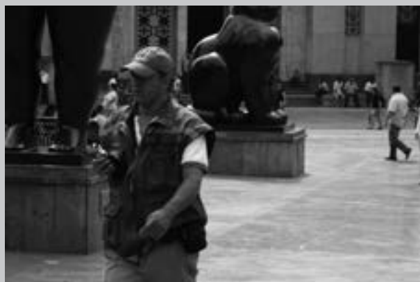
Foto 8. Funcionarios de Espacio Público controlan el orden y las ventas ambulantes.

tarde. A partir de las ocho de la noche y las quincenas de cobro de los trabajadores son días de riesgo en el lugar. A momentos del día y por testimonios, en la noche no hay vigilancia. Lo que, por otra parte, significa un descanso para quienes son incomodados por su apariencia.