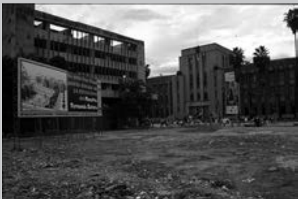
Foto 1. Edificaciones que fueron demolidas para la construcción de la Plazuela de las Esculturas. Museo de Antioquia. (1999/2000)