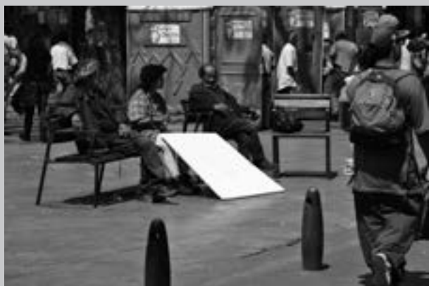
Foto 7. Pasaje peatonal Carabobo. O. Acevedo. Colección privada (2010)