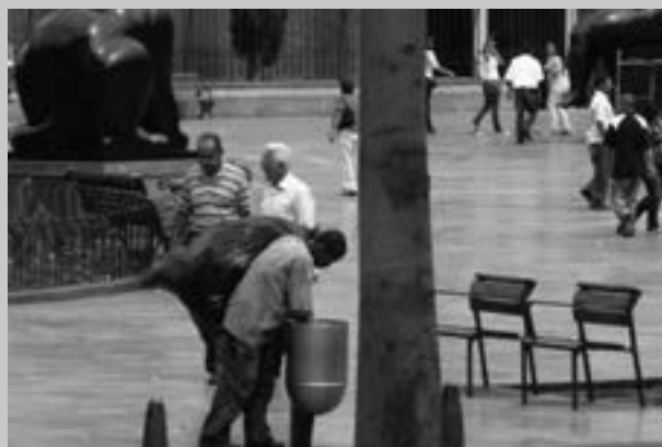
Foto 4. Jardinería de la Plazuela de las Esculturas.