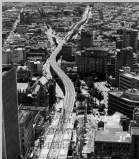
Foto 10. Construcción del viaducto del sistema Metro. [aprox. 1990-1995]