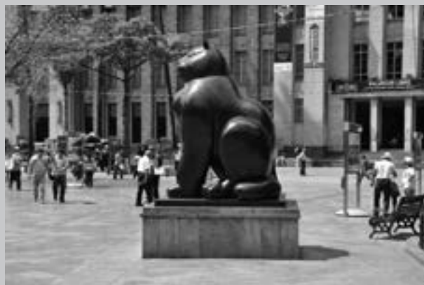
Foto 2. Plazuela de las Esculturas. O. Acevedo. Colección privada (2010)