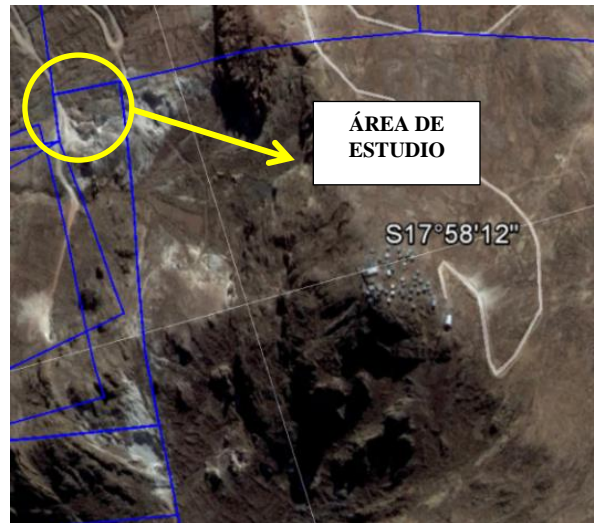
Figura 2.- Ubicación del yacimiento de caolín estudiado

Como se puede observar en la imagen siguiente, la concesión de la Carrera de Ingeniería de Minas, es muy extensa; tiene 2 sectores de explotación de Caolín, y en este estudio, solamente se ha considerado el sector de la izquierda (S 17°58'12").