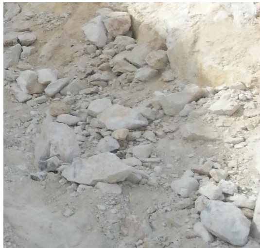
Fotografía 1.- Muestra del caolín del yacimiento

La fotografía siguiente, muestra el material presente en el yacimiento.