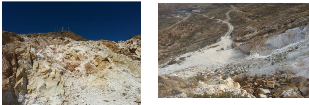
Fotografía 2.- Vista del yacimiento de caolín

Las fotografías siguientes, muestran el depósito de caolín: