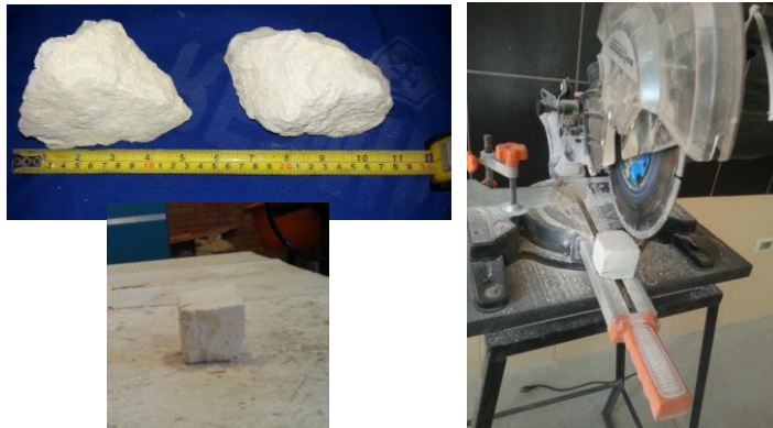
Figura 3.- Preparación y ensayo uniaxial efectuado de la muestra de caolín del yacimiento

posible romperlo con el golpe de la cuchara de una pala mecánica. Las fotografías siguientes muestran las etapas de preparación de la muestra y el proceso del ensayo uniaxial efectuado.