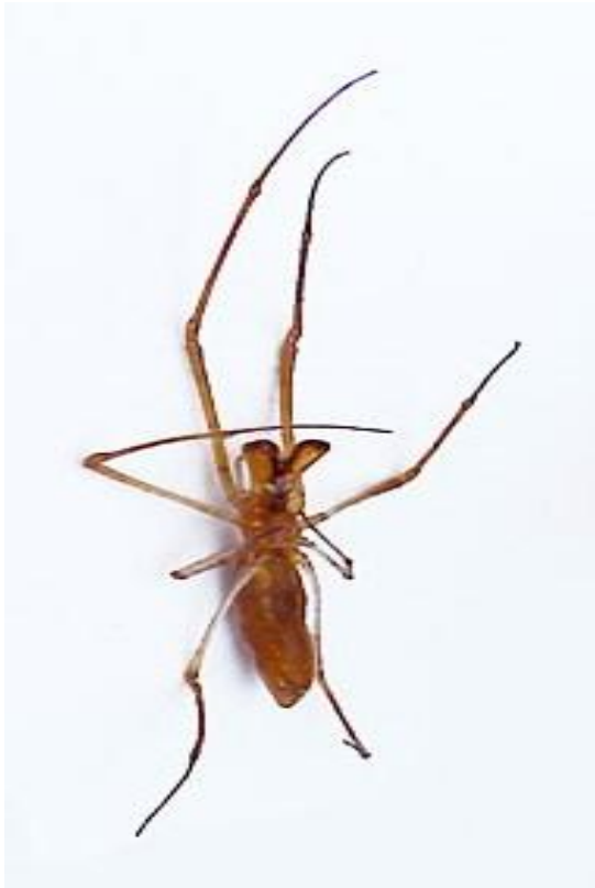
Figura 3. Adulto de Tetragnatha spp.