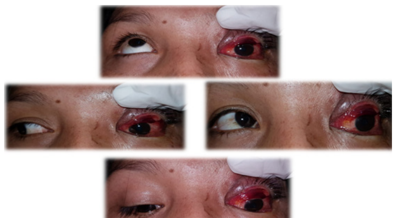
Figura 2: Limitación al movimiento ocular izquierdo, afectación del 3er, 4to y 6to nervio