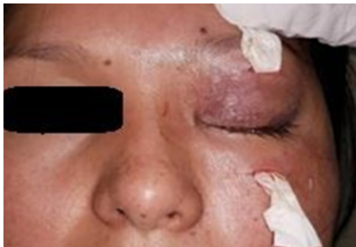
Figura 1: Edema bpalpebral y drenaje de Penrose

Al segundo día post drenaje, la paciente refiere baja agudeza visual (AV) en ojo izquierdo, motivo por el cual se solicita valoración por el servicio de oftalmología. A la exploración: agudeza visual (AV) ojo derecho: 20/20. Ojo Izquierdo: percepción de luz con buena proyección, al examen externo; ojo derecho: pupila reactiva, sin alteración evidente; ojo izquierdo: edema bpalpebral, limitación a los movimientos oculares evidenciando afectación del III, IV y VI nervio craneano izquierdo y la presencia de drenaje Penrose ( Figura 1-2 ).