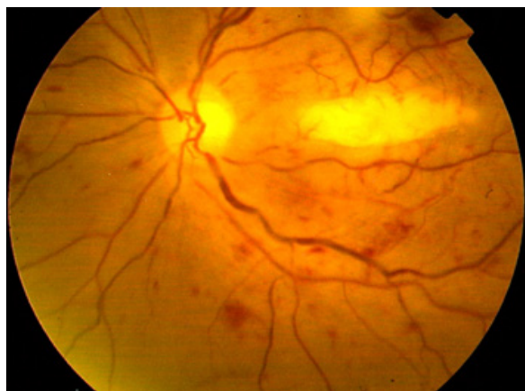
Figura 3: Papiledema, papila pálida, hemorragia en 4 cuadrantes, oclusión vascular, lesión blanquecina en mácula

A la biomicroscopia; ojo derecho: segmento anterior normal; ojo izquierdo: pupila en midriasis media, quemosis conjuntival e intensa hiperemia conjuntival bulbar. Retinografía ojo derecho: Sin alteraciones. Ojo izquierdo: papila de bordes sobre elevados y pálida, múltiples puntos hemorrágicos en los 4 cuadrantes, oclusión vascular, lesión blanquecina horizontal sobre elevada en área macular. ( Figura 3 ). Tomografía de coherencia óptica de macula ojo izquierdo: colección de líquido submacular con tracción subretinal. ( Figura 4 ).