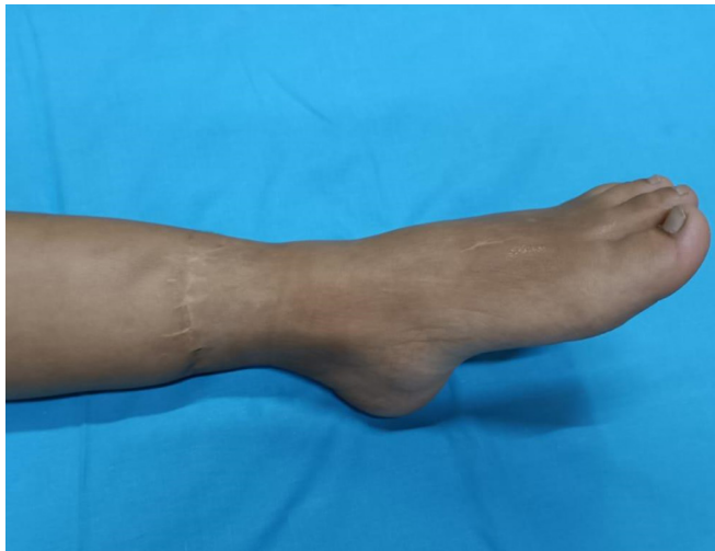
Figura 7. Recuperación funcional y estética a los siete años