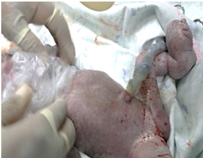
Figura 3. Recién nacido con anillo constrictor en la pierna con elefantiasis distal