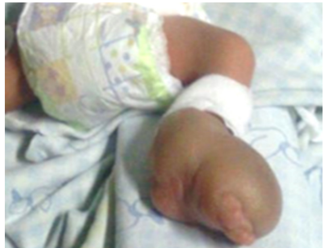
Figura 5. Recién nacido después de la primera liberación de urgencia del anillo constrictor