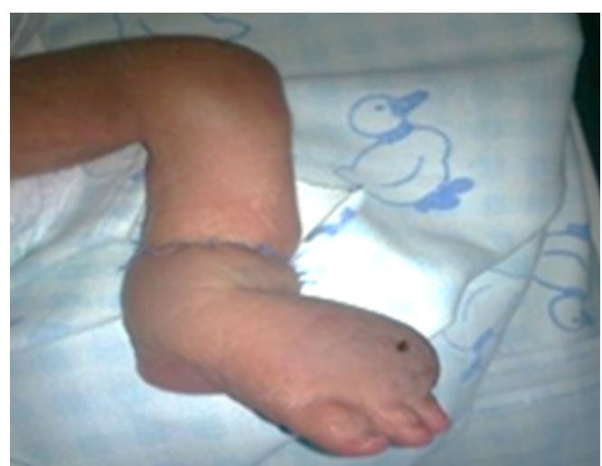
Figura 6. Recién nacido después de la segunda liberación definitiva a los 20 días