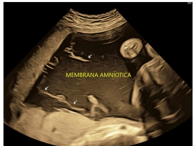
Figura 8. Bandas avasculares flotando libremente dentro de la cavidad coriónica