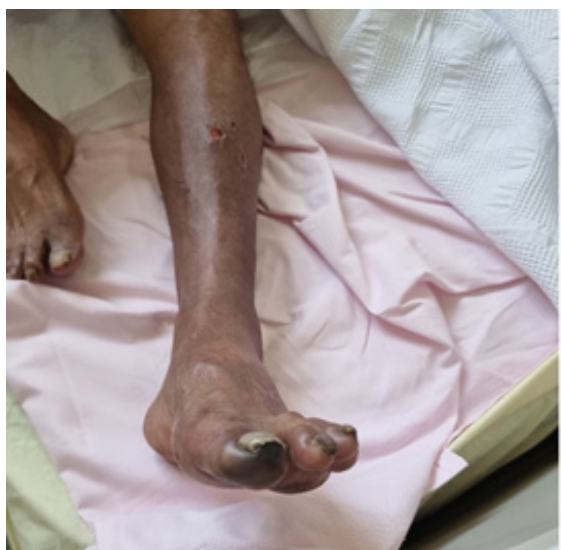
Figura 1. Ausencia de pulsos femorales, poplíteos y tibiales posteriores, concomitantes con frialdad y cianosis distal del primer dedo del pie izquierdo.

distal y ligera limitación para la deambulaci3n distancias habituales.