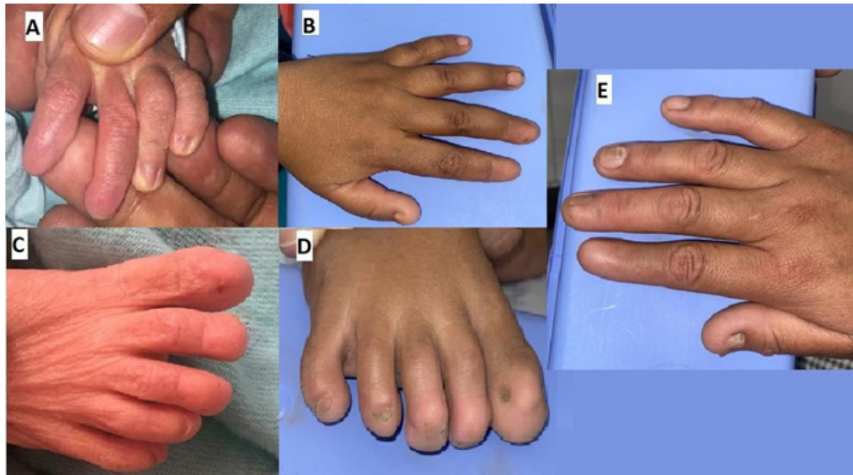
Figura 1. Anoniquia total del dígito 2, hipoplasia ungueal dígitos 1 y 3 y dígitos 4 y 5 normales. Recien Nacido (panel A y C) hermana (Panel B y D) Madre (panel E)

los dígitos 4 y 5 completamente normales. (figura 1) Resto del examen físico de piel y faneras sin alteraciones evidentes. La radiografía no mostro ninguna alteración esquelética (Figura 2).