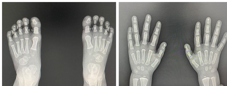
Figura 2. Radiografía de pies y manos. (falanges normales)

De acuerdo con Basta y col, las mujeres afectadas pueden transmitir el alelo mutante al 50% de los hijos varones y al 50% de su descendencia femenina 5 .