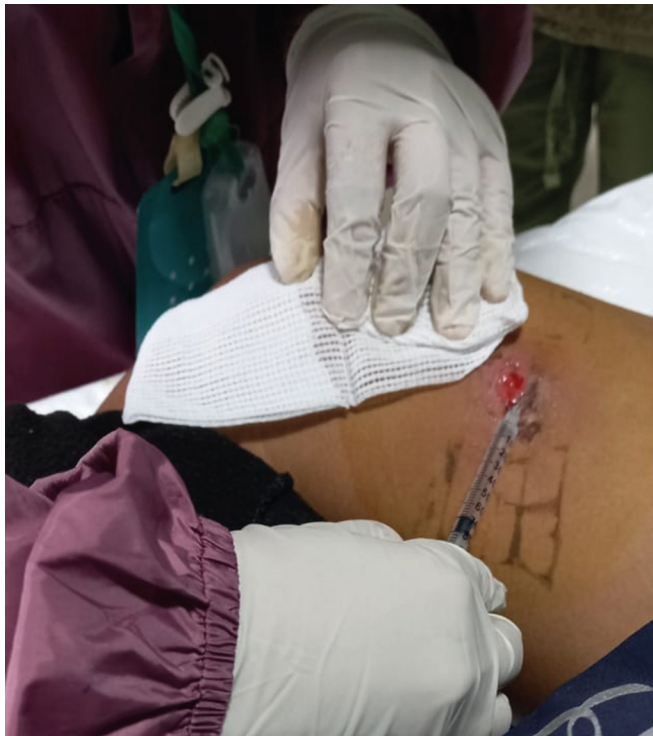
Figura 1. Aplicación intralesional de Glucantime® dos milímetros por encima del borde de la lesión

intralesional de antimonio en pacientes que recibieron un primer tratamiento sistémico con antimonio, pero que no completaron la curación clínica, ha permitido que alcancen la cicatrización a la finalización de la aplicación intralesional 21 . Solo dos estudios en Bolivia con participación del CUMETROP, han reflejado la necesidad de mejorar los criterios de elección de pacientes para la protocolización del tratamiento intralesional como opción de aplicación terapéutica en leishmaniasis cutánea. Además, considerando que, durante el curso de la evolución de la leishmaniasis cutánea, los parásitos se encuentran en el sitio de la lesión, el tratamiento intralesional contribuiría a resolver muchos problemas relacionados a los efectos indeseados en los pacientes por efecto del tratamiento sistémico, así como también riesgos de toxicidad y elevados costos al programa nacional de leishmaniasis. El objetivo del presente estudio fue evaluar la eficacia clínica de la aplicación intralesional de tres inyecciones durante una semana, versus, seis inyecciones durante dos semanas en pacientes con leishmaniasis cutánea.