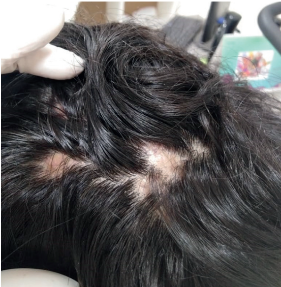
Figura 1. Nódulos en cuero cabelludo fluctuantes de varios tamaños, dolorosos.