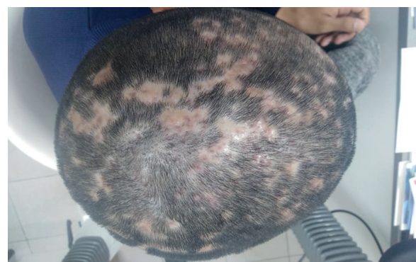
Figura 4. Posterior a dos ciclos de antibiótico, lesiones anulares de áreas de alopecia, algunas otras placas con repilificación, ya sin signos flogísticos.

El caso expuesto es llamativo por su escasa frecuencia, la presente puede dar pie al desarrollo de estudios o investigaciones mas detalladas y profundas