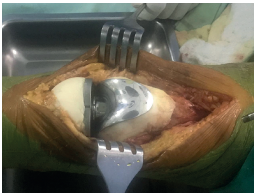
Figura 3. Imagen del tiempo quirúrgico posterior al colocación de la prótesis y del cemento óseo (polimetilmetacrilato)

hemograma, parámetros bioquímicos, fosfatasa alcalina y deshidrogenasa láctica, se encontraban dentro de los rangos normales.