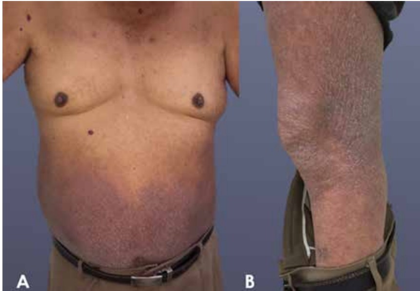
Figura 4. Areas hipercrómicas y descamativas en abdomen y miembros superiores con reacción eczematososa (A). Miembro inferior izquierdo con lesiones hiperqueratósicas, descamativas y costras hemáticas (B).

en dosis de 200 \mu\text{g}/\text{kg} por dos veces con una semana de separación entre las dosis (nivel de evidencia Ib; grado A de recomendación); en casos graves de la enfermedad se recomienda dar ivermectina vía oral 200 \mu\text{g}/\text{kg} el día 1, 2 y el día 8; si el cuadro clínico es muy severo con persistencia de los ácaros en la piel del paciente, se puede requerir dosis adicional de ivermectina los días 9 y 15 o incluso los días 9, 15, 22 y 29 (nivel de evidencia IV; grado C de recomendación), se ha visto que hasta el 92,5% de pacientes se cura con dos o tres dosis de este medicamento 9,10 . En cuanto al tratamiento tópico se puede utilizar permetrina al 5%, benzoato de bencilo al 25 %, en escabiosis vulgar se puede usar también azufre precipitado y bálsamo del Perú. En este caso en particular se optó por un tratamiento médico con dosis de ivermectina por vía oral de 200 \mu\text{g}/\text{kg} con dosis de repetición y por vía tópica al 1%, no se optó por benzoato de bencilo debido al efecto de irritación local y dermatitis que podría exacerbar el cuadro clínico del paciente 3 .