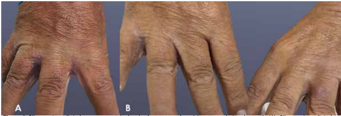
Figura 2. Pliegues interdigitales con presencia de pápulas y costras hemáticas secundarias al rascado (A). Pliegues interdigitales a los diez días del tratamiento (B).

A los siete días se realiza un control, donde se observó mejoría clínica de las lesiones, sin embargo, aún se observaron áreas hipercrómicas en región del tronco y descamación en ciertas zonas (Figura 2-B y 4). Se continúa con el tratamiento tópico de ivermectina al 1% los días siete y catorce. Se programa nuevamente un control a los catorce días finalizando el tratamiento, en el que el paciente muestra mejoría clínica notable de las lesiones (Figura 1-B).