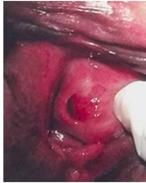
Figura 2. Uretra desplazada

Control postquirúrgico a las tres semanas, paciente sin incontinencia urinaria de esfuerzo con orina residual dentro de parámetros normales.