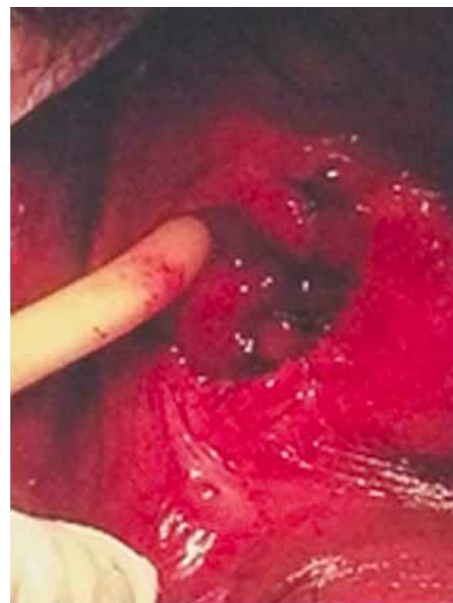
Figura 4. Lecho para-uretral de masa rescada