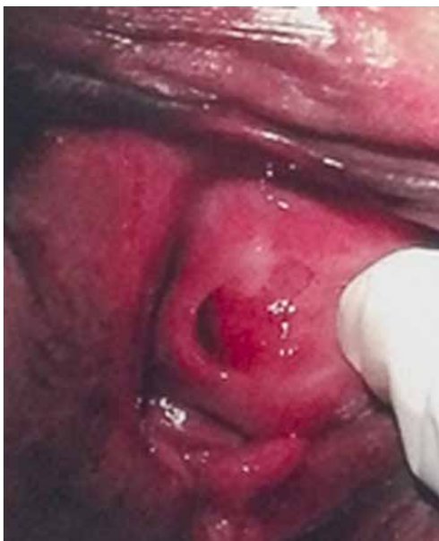
Figura 3. Excéresis de masa parauretral

El diagnóstico diferencial incluye las siguientes patologías: prolapso de compartimiento anterior, divertículo uretral, carúncula uretral, quiste de conducto de Skene, quiste del conducto de Gartner, quiste mülleriano remanente, quiste epitelial de inclusión, ureteroceles ectópicos, quiste parauretral congénito, neoplasia vaginal, leiomiomas, pólipos fibrosos, carcinoma uretral y tumores mesenquimatosos 4 .