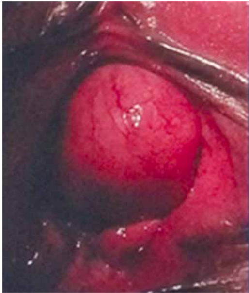
Figura 1. Masa parauretral.